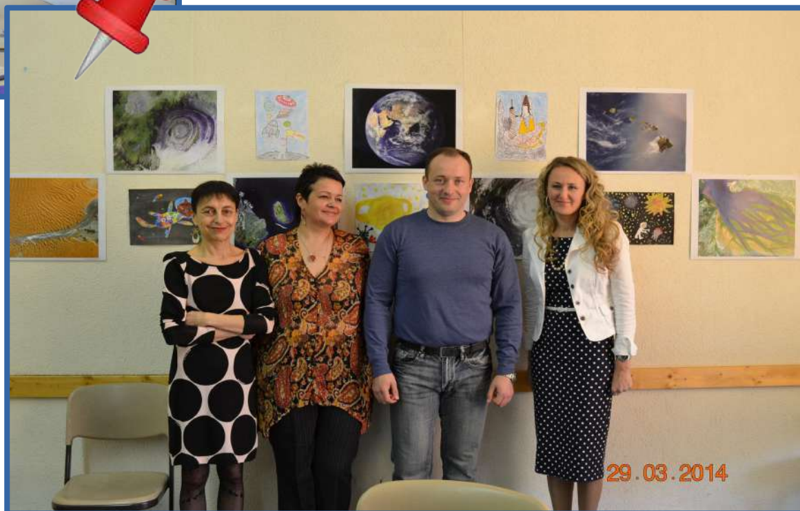
космонавт Александр Мисуркин