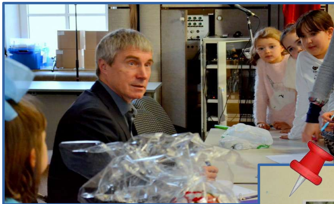
космонавт Сергей Крикалёв